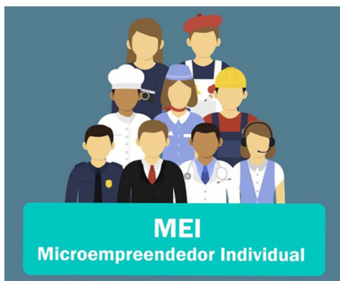
Pesquisadora: Ev. Katia Cristina Texto Talita Andrade

Nesta terça-feira (1º) começou valer a resolução que permite que microempreendedores individuais (MEI) sejam dispensados de alvará, ato público de liberação de atividades econômicas relativas à categoria. Um regra que foi aprovada em Agosto, por Comitê para Gestão da Rede Nacional para Simplificação do Registro e da Legalização de Empresas e Negócios (CGSIM).