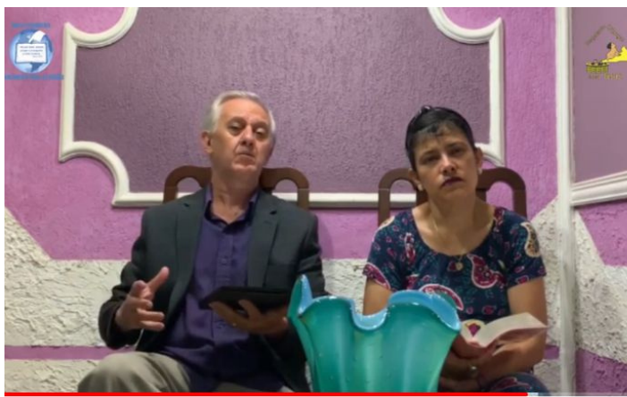
PTV - Vale de Ossos Secos (Parte 1)

E para deixar você ainda mais sedento, trouxemos uma sequência dos programas : Vale de Ossos Secos parte I e II. Basta clicar nas imagens e será direcionado direto para eles.