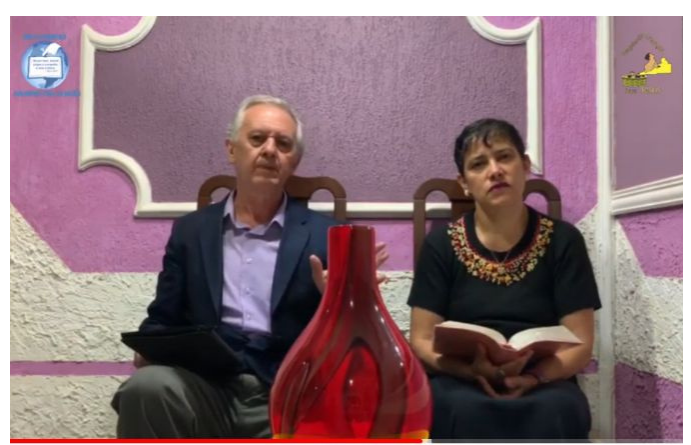
PTV - Vale de Ossos Secos (Parte 2)